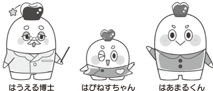
【日本学校歯科医会マスコットキャラクター】